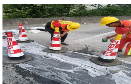
广巴段广巴向 K442+920 处伸缩缝破损修复