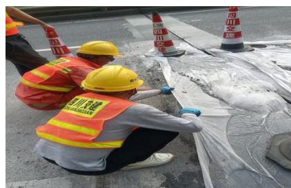
广巴段广巴向 K365+140 处伸缩缝破损修复