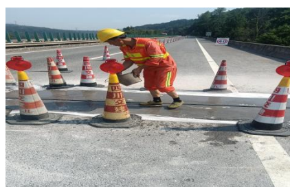
广巴段广巴向 K364+410 处伸缩缝破损修复