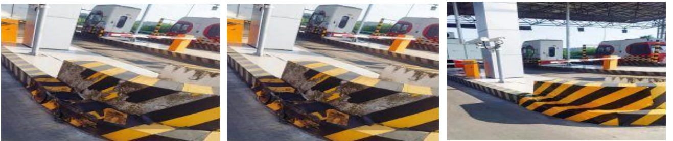
巴南段五福收费站大门口水泥地板破损修复