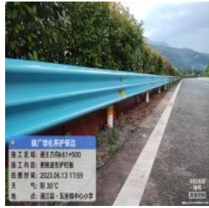
王通段通王向 K61+520 处更换护栏板