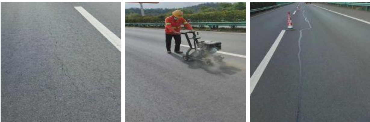
巴南段恩阳主线转巴中西方向匝道车辙拥包处治