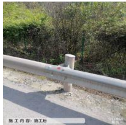
广巴段广巴向 K354+000-K350+000 补设螺栓螺帽