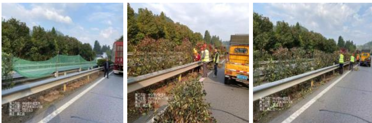
广巴段 K355+600 处中分带绿植补栽