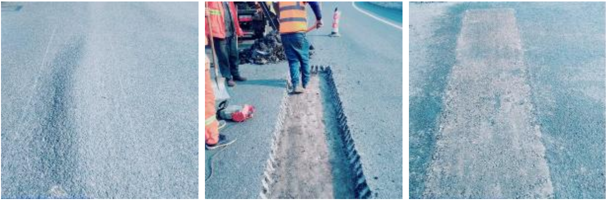
巴陕段 K310+300-K323+800、K854+500-K898+900 处路面坑洞修补