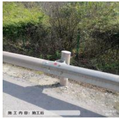
巴陕段 K310+300-K323+800、K854+500-K898+900 护栏螺栓缺失增设