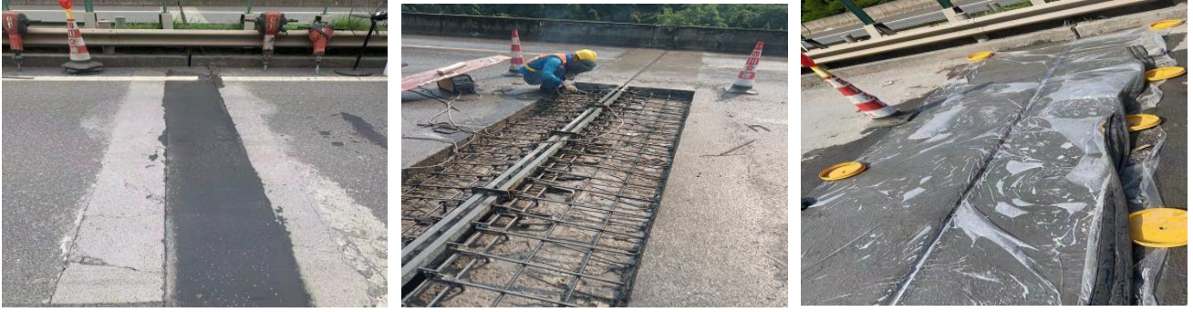
巴南段东兴场互通广元至成都方向匝道桥面拥包处治