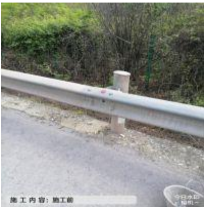
广巴向广巴向 K350+900 补设螺栓螺帽