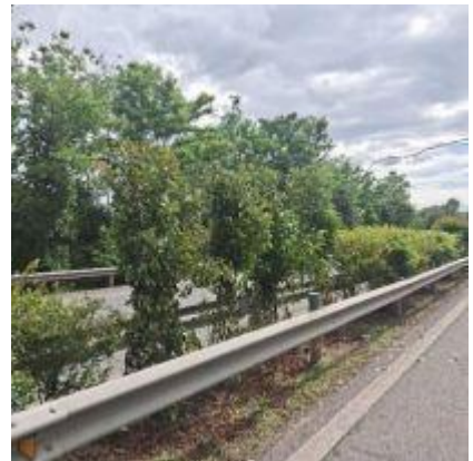
广巴段 K424+400-K481+109 K0-K19+456 中分带植株补栽