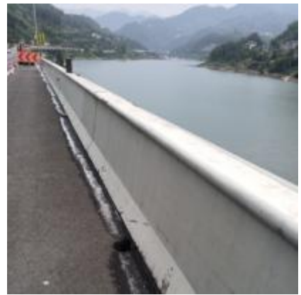
巴陕段巴陕向 826 人工清洗新泽西护栏