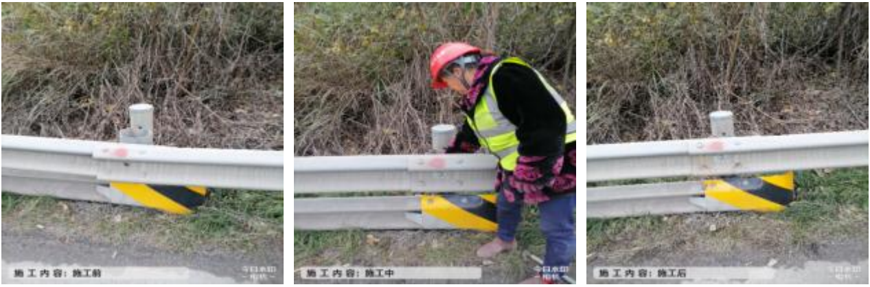
广巴段广巴向 K362+500 护栏板螺栓螺帽缺失更换