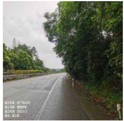
陕段陕巴向 K850 处清理路侧侵界绿植