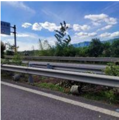
广巴段 K424+400-K481+109 K0-K19+456 中分带植株补栽