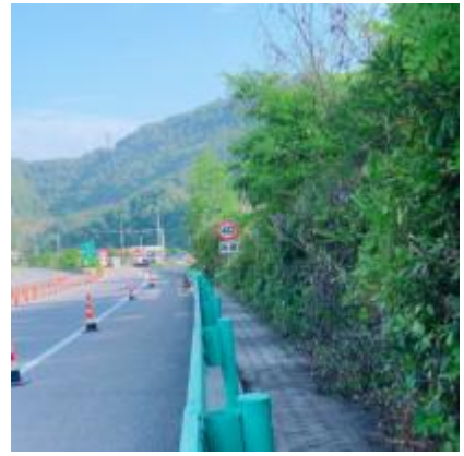
广巴段 K424+400-K481+109、K0-K19+456 路测、边沟清杂修枝